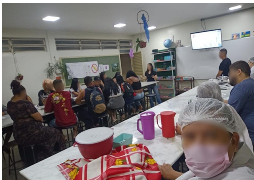
Figura 2. Organização da sala de aula para realização da atividade prática.

Os alunos acompanharam o processo com atenção, demonstrando envolvimento e curiosidade. A educadora explicou os cuidados com a higiene, a pasteurização e o controle de temperatura, destacando que o leite deve ser aquecido entre 42°C e 45°C, faixa ideal para o crescimento de Streptococcus thermophilus e Lactobacillus bulgaricus . Esse diálogo interdisciplinar envolveu conteúdos de Biologia, Química e Ciências dos Alimentos, o que demonstra o potencial das metodologias ativas em integrar diferentes áreas do conhecimento.