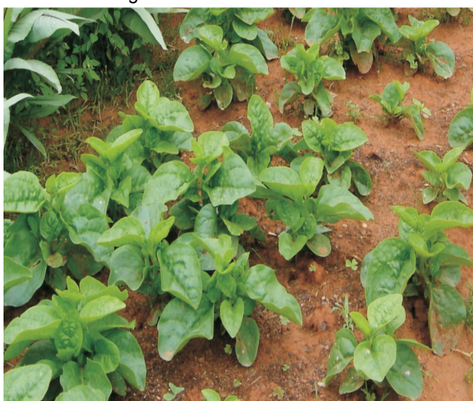
Figura 2 - Bertalha in natura