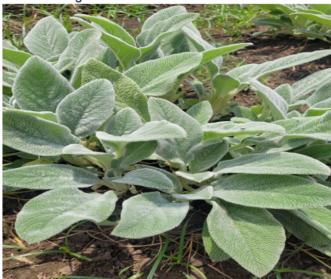
Figura 1. Peixinho da horta in natura