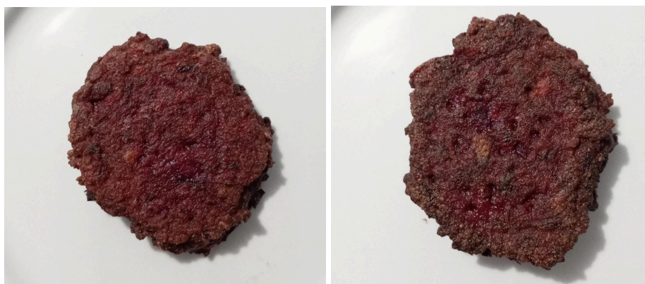
Figura 1.2. Formulação 513 com casca de banana.