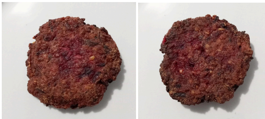
Figura 1.1. Formulação 493 com aveia.

No dia da análise sensorial, os hambúrgueres foram preparados ainda congelados. O processo de cocção seguiu a seguinte ordem: em uma frigideira pré-aquecida com óleo de soja em fogo alto, cada lado foi selado por 1 minuto; em seguida, foram transferidos para outra frigideira em fogo médio, onde permaneceram por 2 minutos e 30 segundos ambas as partes. A temperatura interna foi monitorada em 70 °C com o auxílio de um termômetro digital, temperatura escolhida para padronização da cocção, os resultados finais de ambas as formulações estão registrados nas figuras 1.1 e 1.2.