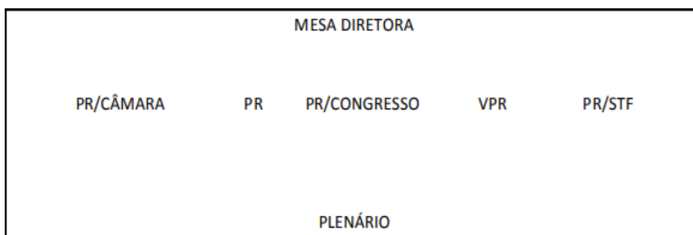
Figura 3: Composição da mesa

A imagem acima ilustra a mesa de honra cerimonial para a posse presidencial do Brasil, indicando os lugares e a precedência. O Presidente da República e o Vice-Presidente da República ocupam a mesa diretora subindo pela escada à direita do Plenário e sentando-se à direita e à esquerda do Presidente do Congresso Nacional, respectivamente. O Presidente da Câmara dos Deputados e o Presidente do Supremo Tribunal Federal sentam-se à direita do Presidente da República e à esquerda do Vice-Presidente da República. A ordem de precedência estabelecida será usada para selecionar os outros membros da mesa, que serão confirmados (TAKAHASHI, 2015).