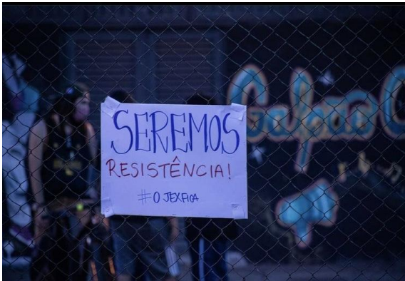
Figura 3 - Praça do Cidadão durante a vigília