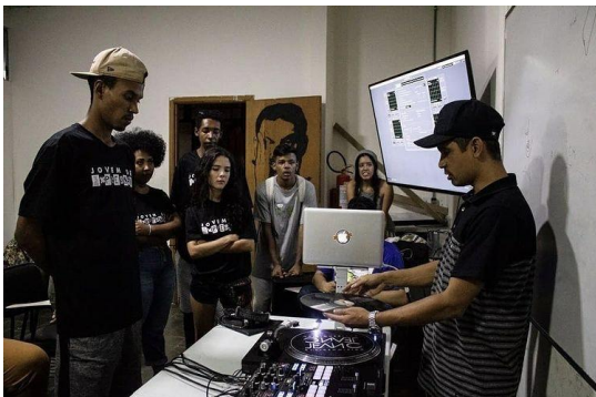
Figura 1 - Oficina de DJs