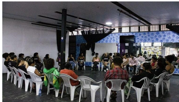
Figura 2 - Fala Jovem: roda de terapia comunitária