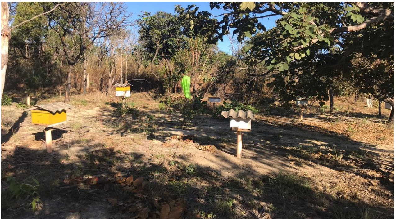
Figura 3 - Imagem Ampla do Apiário.