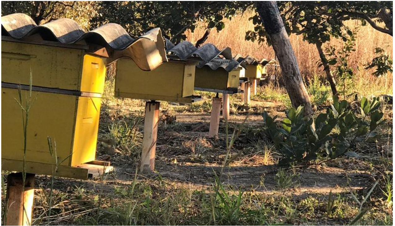
Figura 2 - Imagem das Caixas do Apiário.