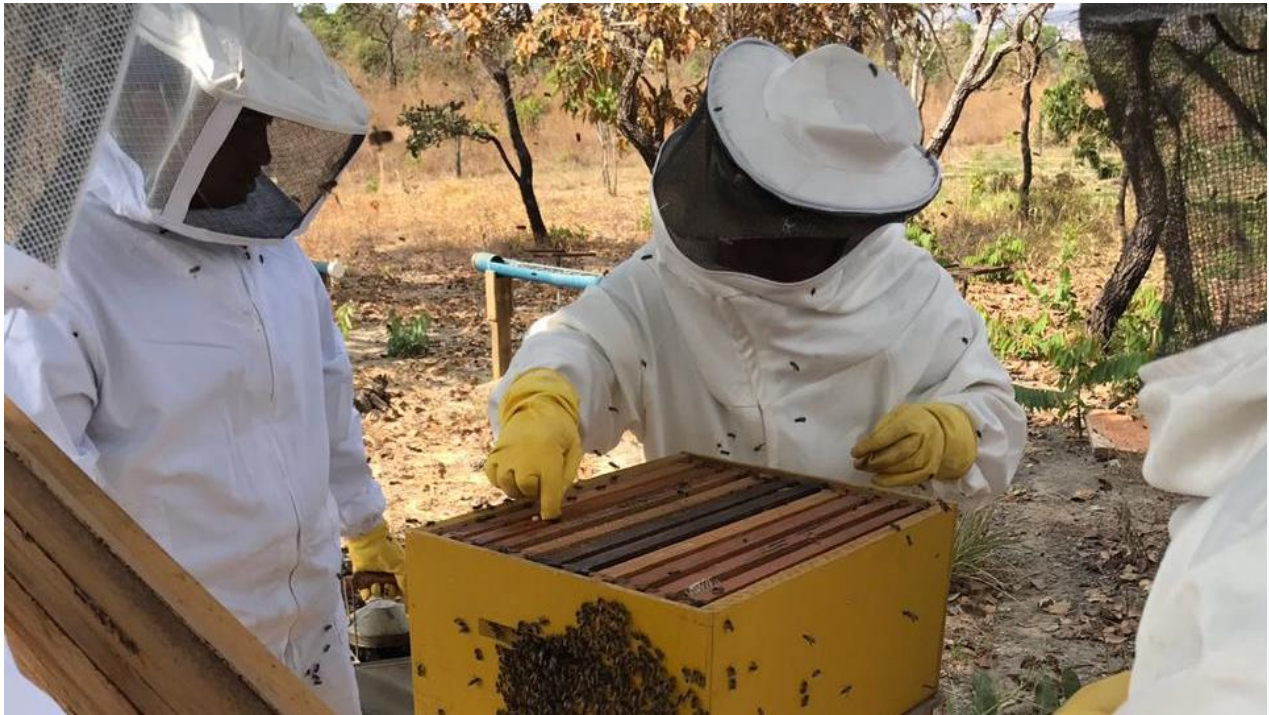
Figura 4 – Manejo no Apiário.

Relativo à infraestrutura da Casa De Mel (local onde ocorre o processamento do mel, cera, própolis, etc.), foram listados itens que integram os equipamentos necessários para o manejo e beneficiamento do mel: