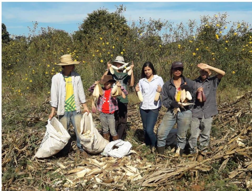
Figura 9. A união da agricultura Familiar