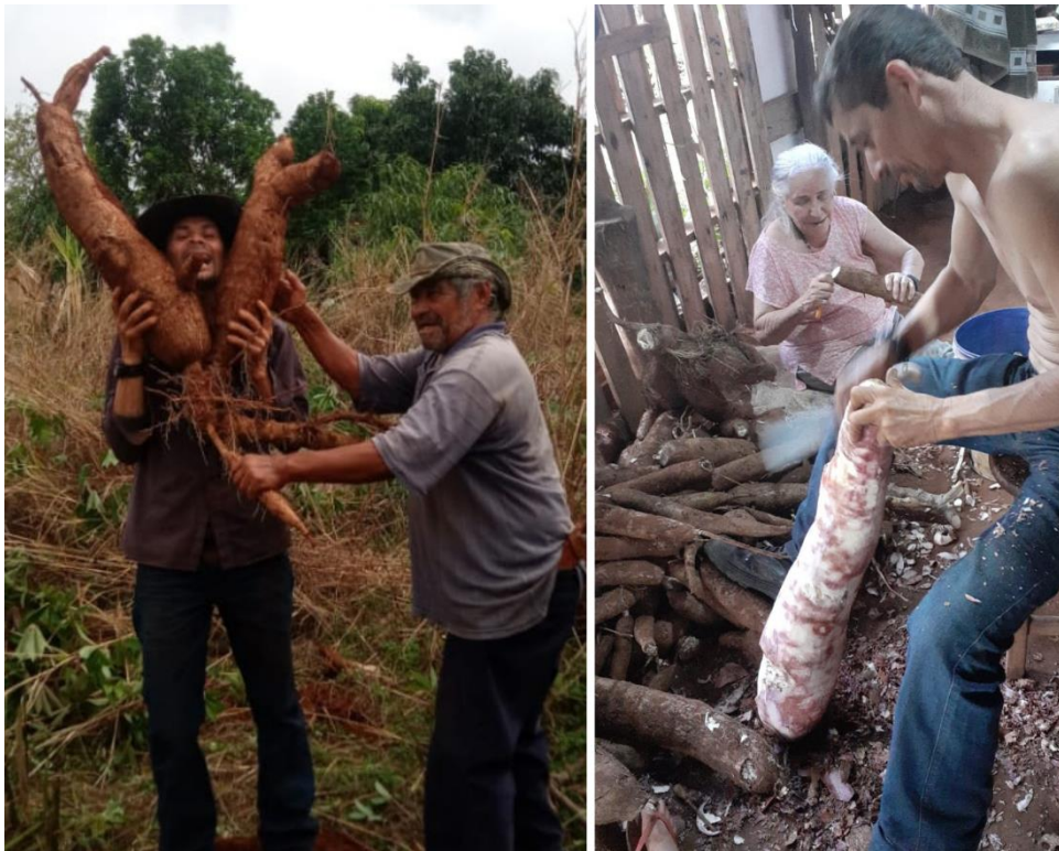
Figura 11 - Colheita da mandioca para os preparativos da farinhaada.