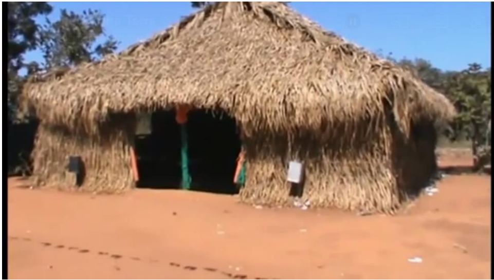
Figura 5. Salão de reuniões dos acampados no acampamento renascer onde acontecia reuniões e festividades.

3) Possui culturas anuais na sua produção familiar como feijão, milho crioulo, mandioca, arroz? Explique como sua família produz desde a semeadura, cultivo, colheita, e quem trabalha nesse processo e se é familiar, cite suas funções de cada um da família e agregados.