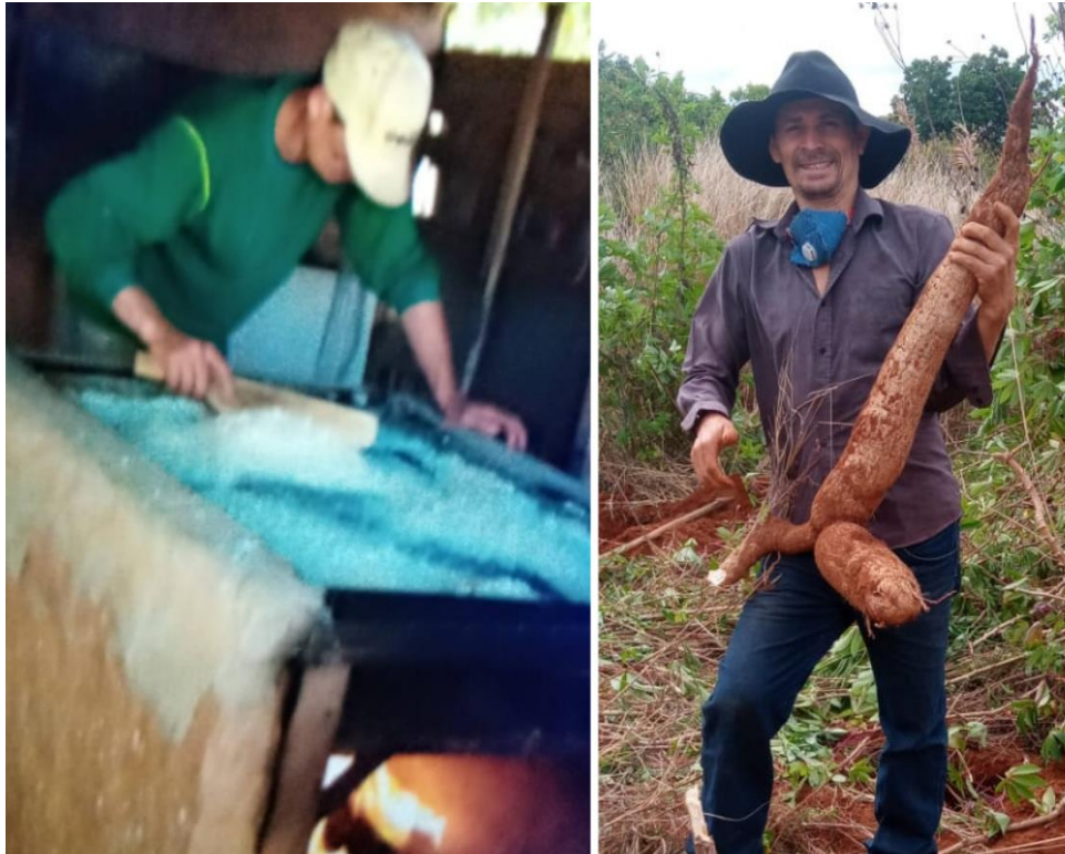
Figura 12. Dia da farinha que foi toda produzida em familiar e agregados do acampamento.