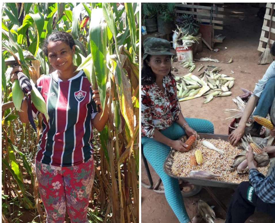
Figura 2. Plantação e debulha de milho crioulo