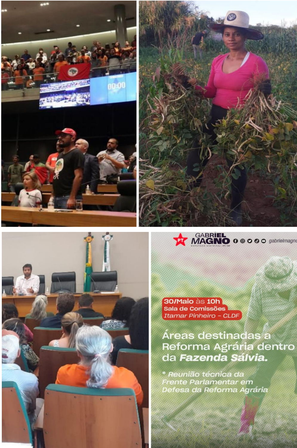
Figura 4. Lançamento da Frente parlamentar em defesa da reforma agraria, na câmara legislativa do Distrito Federal, Gab.16. Fonte: elaborado pelo autor, (17 de abril de 2023).