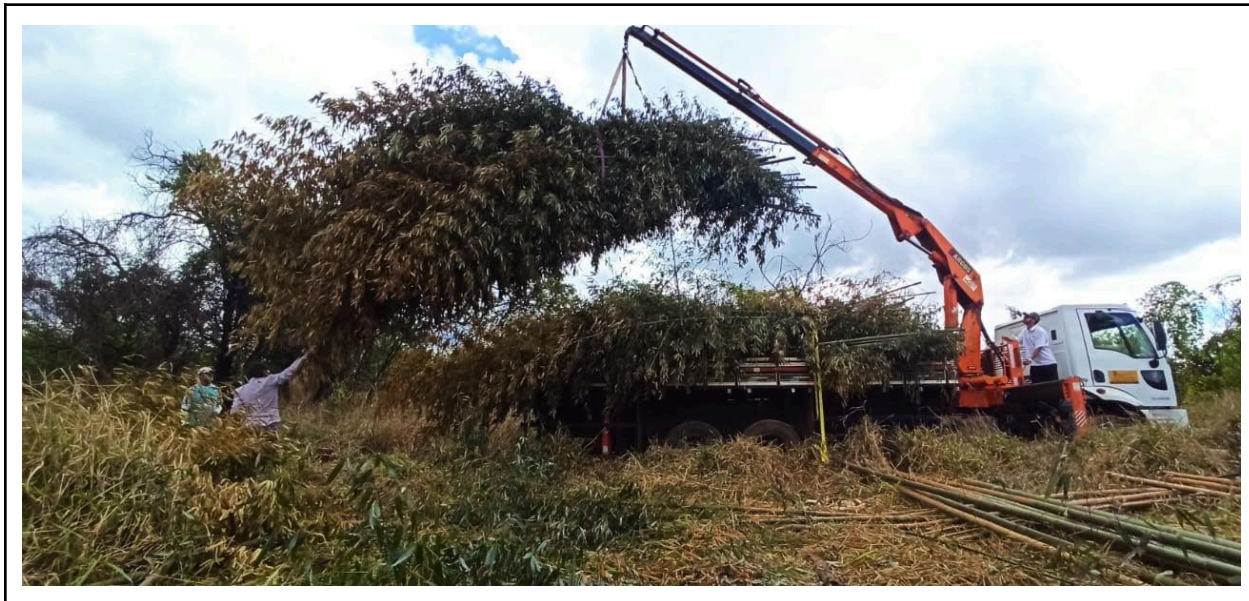
imagem 4 carregamento dos Bambus ESECAE/ outubro/2022