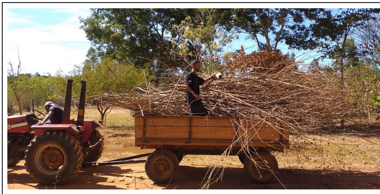
imagem 3 do primeiro mutirão Ecoa maio/2022