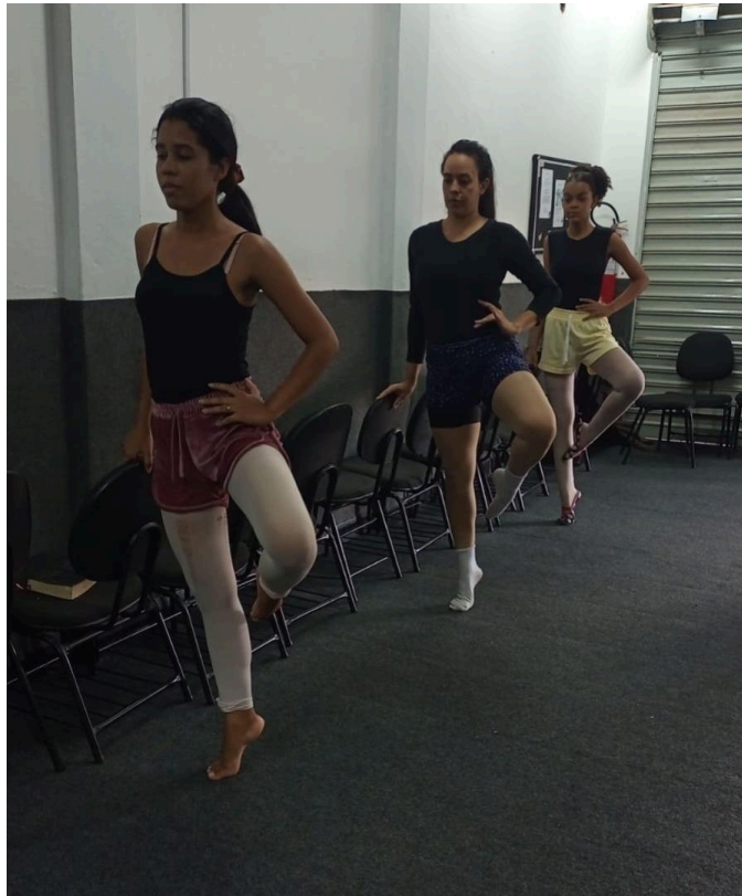
Figura 1: A prática do passo de Ballet Clássico “Passé Relevé”

musculatura de todo o corpo, especialmente das pernas, abdômen e glúteos (Agostini, 2010)