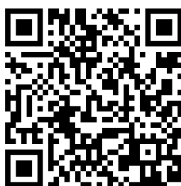
Figura 4: QR code para acesso a visualização do vídeo.

5ª Espaço - Sala da Palavra: espaço aberto sem cadeiras e com meia luz, onde aconteceu a apresentação e roda de conversa com os participantes do Culto Criativo.