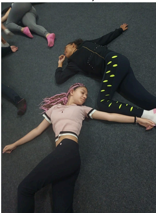
Figura 3: Momento de Sensibilização da aula de Criatividade.

A recepção dos encontros com a “sensibilização”, foi um ponto bem comentado durante o trajeto do curso. Devido a rotina do dia a dia e a quantidade de informações no cotidiano, a capacidade de desacelerar não se torna uma habilidade acessível todos, conforme relatado por uma das alunas, a prática de meditação guiada proporcionou uma sensibilização que resultou em melhorias no foco, na concentração e o bem estar-emocional dela naquele dia. Esse tipo de comentário foi observado com frequência ao longo dos dias. A partir dos comentários das Ministras de Dança, percebi que, durante nossos ensaios rotineiros, os encontros eram diretamente voltados para as práticas, sem um momento dedicado a compreender o estado em que elas se encontravam. Após a aplicação do curso ministrado, tornou-se um hábito perguntar como elas estão e se estão disponíveis para dançar antes de iniciar as atividades.