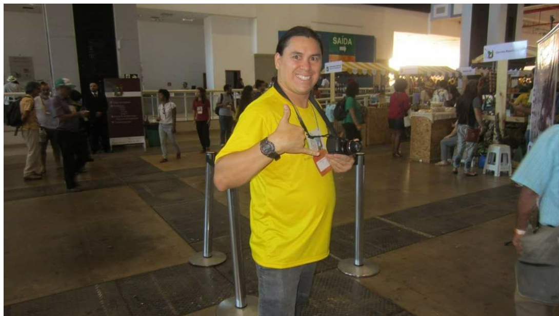
Figura 4. Participação no Congresso Brasileiro de Agroecologia.

Em outra ocasião de outra visita técnica aos sábados, uma das minhas professoras levou um espanto de mim quando eu fui por conta de risco, da minha pessoa, pegar algumas caronas de estranhos, no qual não podia ir. Mas eu fui chegando aos poucos conhecendo as rotas de divisas de estados Distrito Federal e Minas Gerais, no qual eu cheguei a tempo do almoço com os meus colegas da disciplina de suínos em bases Agroecológicas, e aí fui descobrindo os meus lados de ser especial, que eu posso ir mais além dos as pessoas acham que podemos fazer algo que algumas pessoas acham que devemos fazer, não somos livres.