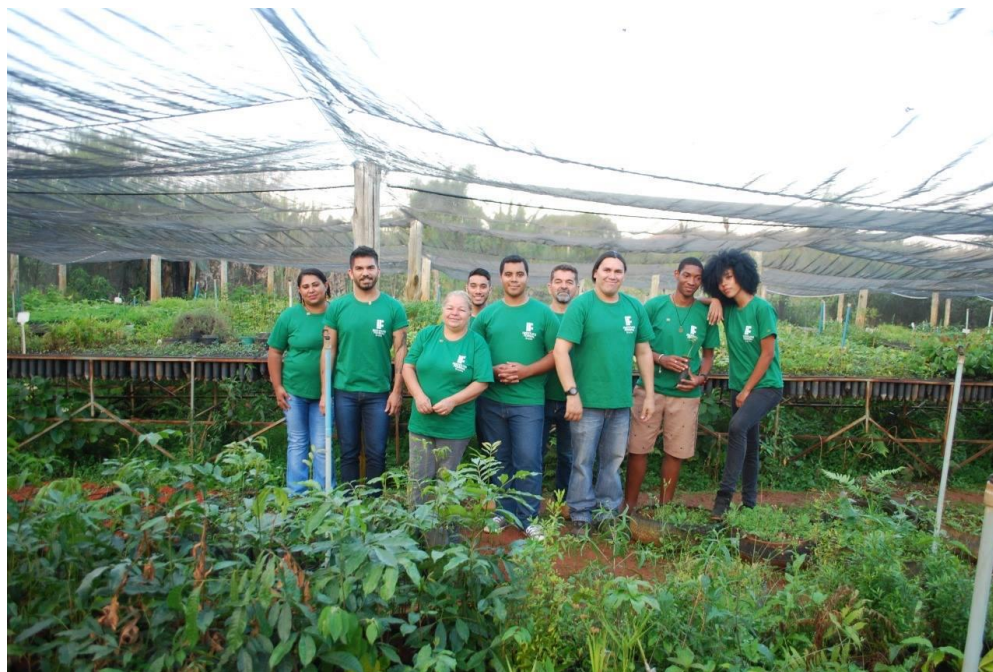
Figura 5. Práticas no viveiro do IFB.