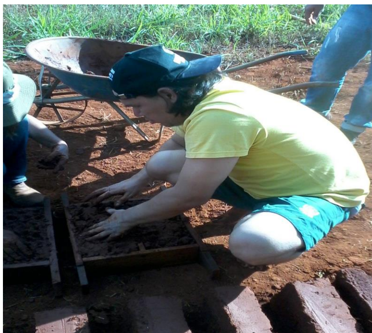
Figura 1. Construção de tijolos de barro no Assentamento Pequeno Willian – DF.

No final do semestre de 2015 pude comparecer a uma palestra com outros alunos e servidores que tinham outras deficiências e assim como eu podemos ir mais além. Foi uma experiência incrível.