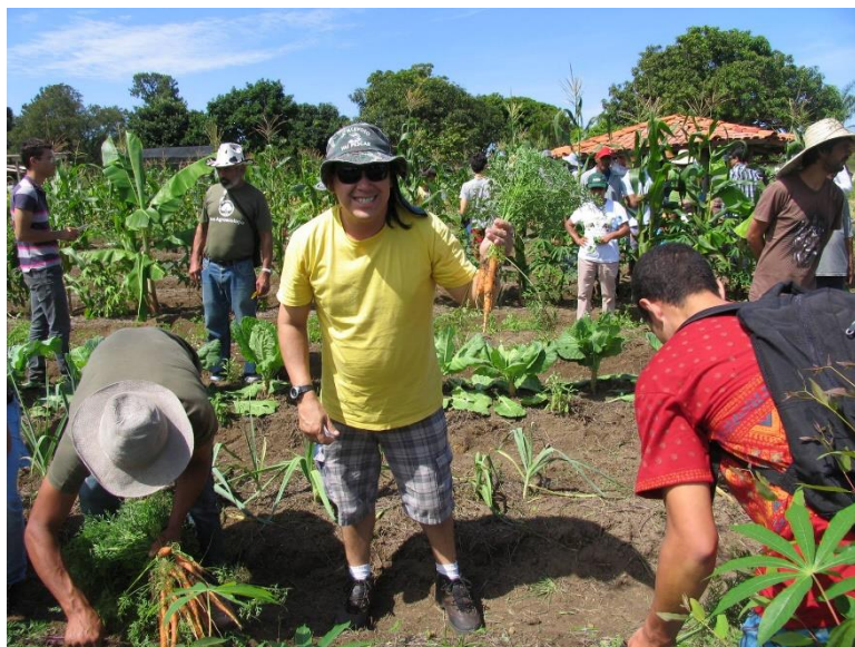
Figura 3. Visita técnica em propriedade agroecológica na região de Sobradinho - DF.