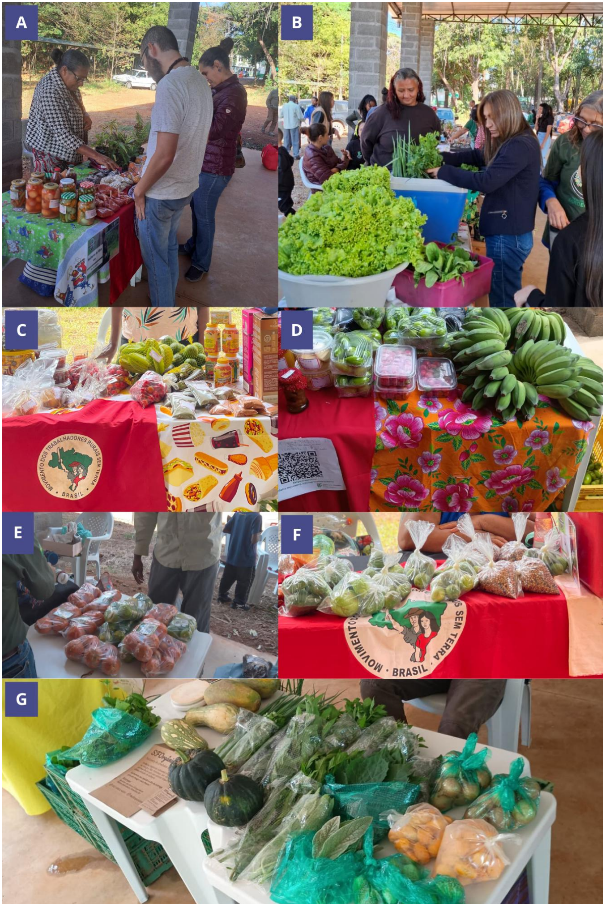
Figura 1: Feira Agroecológica do IFB, Campus Planaltina . A-B ) Momento de Interação entre feirantes e consumidores; C, D, E, F e F ) Representatividade dos movimentos sociais na comercialização dos produtos.