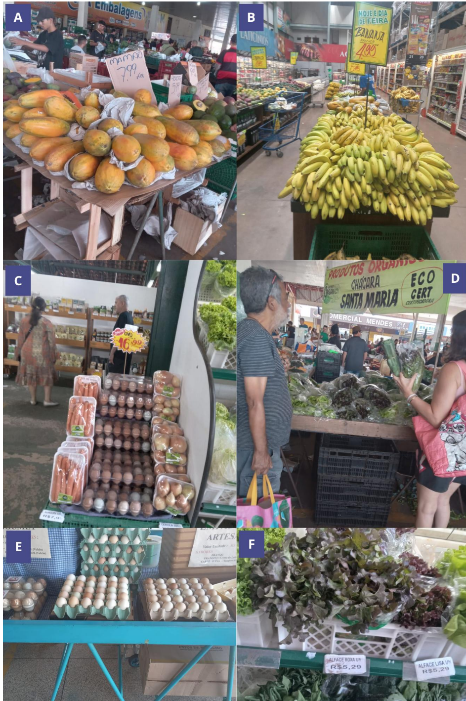
Figura 2: Locais de observação de preço. A-B) Produção convencional (Ceasa e Supermercado, respectivamente); C, D e F) Produtos Orgânicos Certificados. E) Ovos caipiras agroecológicos.

Agroecológica no cenário mercadológico mais amplo de Brasília (DF). Os canais de comercialização comparados foram: o Mercado Convencional (supermercados e CEASA) e o Mercado Orgânico Certificado (Figura 2).