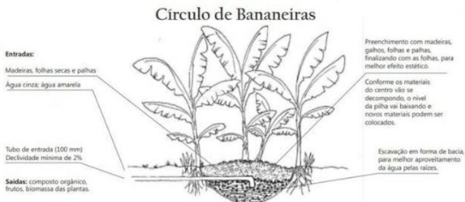
Figura 3:

A oficina de construção do círculo de bananeiras (figura 4.) foi realizada na chácara São Sebastião situada na BH do Capão da Onça, pertencente ao meu pai, pioneiro e bastante conhecido na região. Contou com a participação de quinze estudantes do curso Superior de Tecnologia em Agroecologia do Instituto Federal de Brasília – Campus Planaltina, da professora responsável pela componente de comunicação e extensão rural e 16 moradores da comunidade, somando assim, trinta e dois participantes. Os estudantes construíram a oficina participativamente e abordaram temas como: recuperação e proteção das nascentes, ações de melhorias no manejo das pastagens e a importância das árvores no sistema de conservação e produção, divisor de águas, bacia hidrográfica, reutilização e manejo da água e esgoto. Logo após iniciou a construção do ciclo de bananeiras em mutirão. O objetivo da oficina foi demonstrar aos participantes o passo a passo da construção e o funcionamento para que, se apropriando da tecnologia pudessem multiplicar as ideias e práticas em suas casas. O mutirão trouxe também o diálogo sobre a importância de ações coletivas na comunidade.