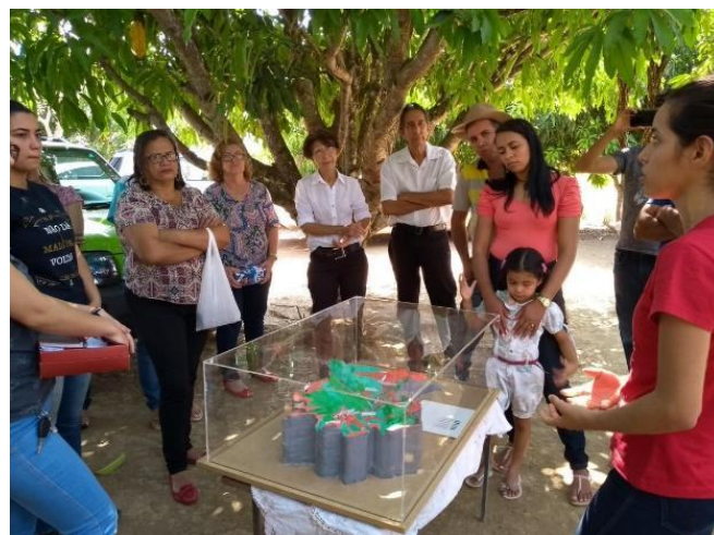
Figuras 5 e 6: Oficina sobre BH uso da maquete e simulador de erosão do solo realizada em agosto de 2018.

Esta atividade aconteceu após a celebração da missa na casa de um morador no alto da BH e de forma receptiva, todos e todas ouviram atentamente a dinâmica e fizeram perguntas que trouxeram reflexões sobre questões que envolvem a temática.