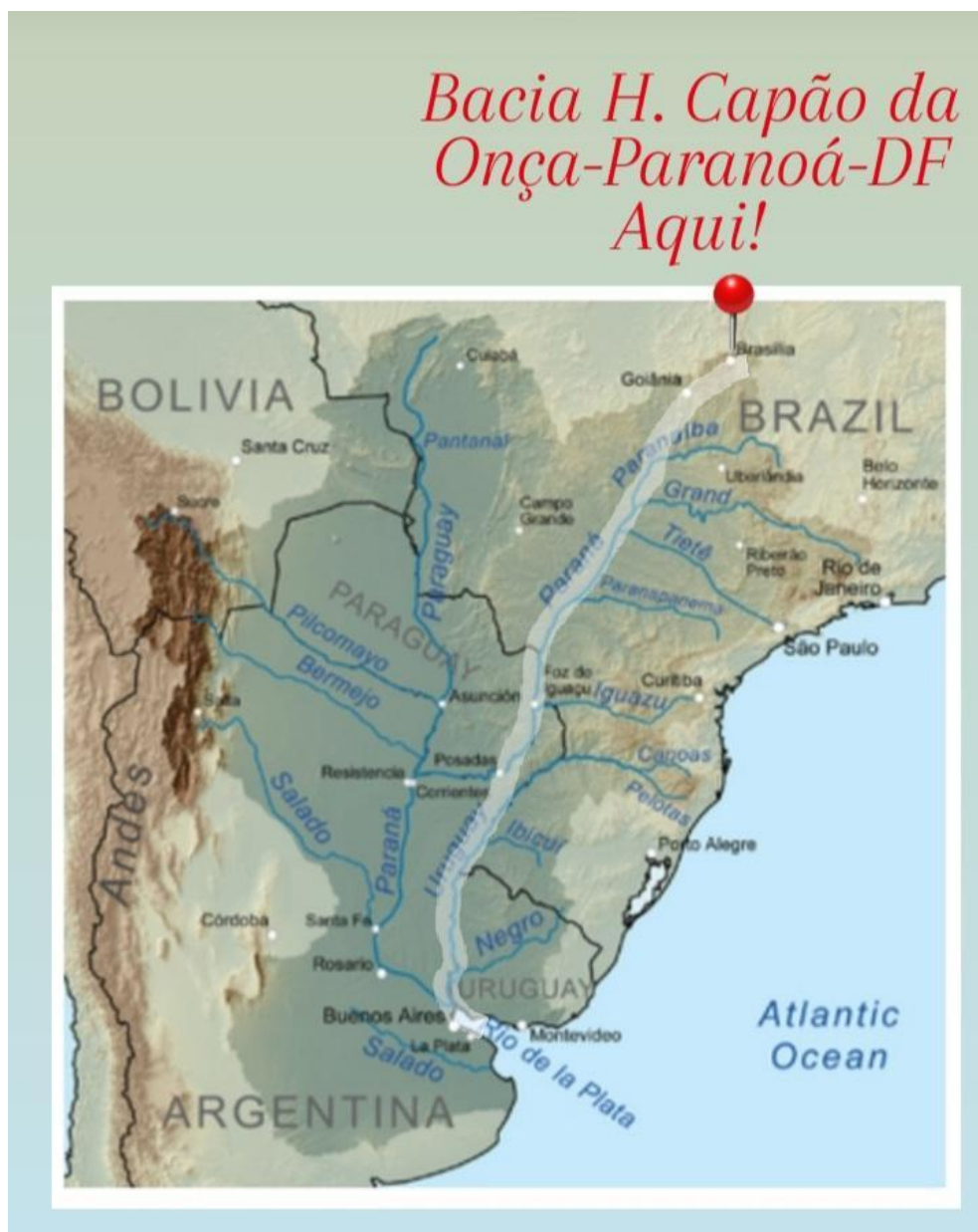
Figura 2. Bacia Hidrográfica do Rio da Prata com destaque para uma de suas nascentes, o córrego Capão da Onça.

Existem caminhos e alternativas de valorização socioambiental do Cerrado e seus recursos hídricos por meio do uso sustentável. E uma agricultura sustentável na visão de GLIESMANN (2001) é pontuada em: