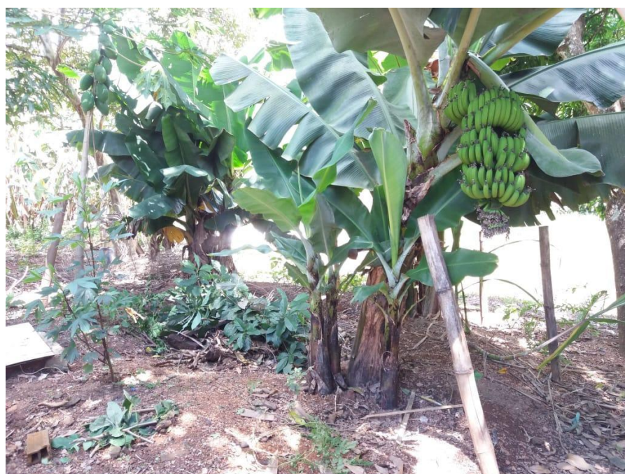
Figura 5. Círculo de Bananeiras (2019)