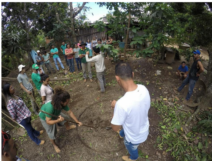
Figura 4. Mutirão para construção do Círculo de Bananeiras (2018)