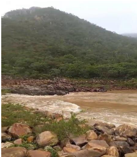
Figura 3: Rio Paranã, um dos lugares de pesca da comunidade

Instituto Federal de Educação, Ciência e Tecnologia de Brasília