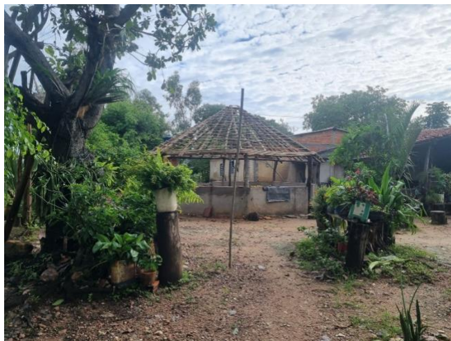
Figura 1: Ranchão de Palha, fotógrafo: Maxsuel da Silva Comunidade Diadema/Ribeirão GO

Instituto Federal de Educação, Ciência e Tecnologia de Brasília