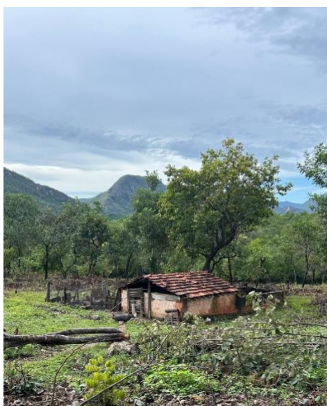
Figura 2: Chiqueiro utilizado para criação de porcos.