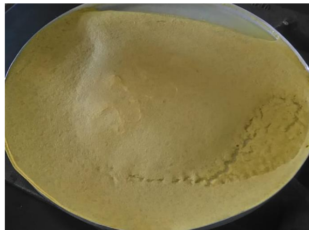
Figura 3. Espuma da cagaita, processo dois.