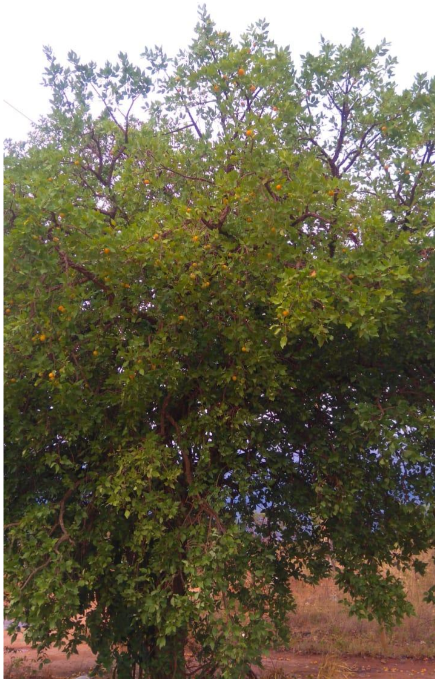
Figura 1. Frutos de Cagaita verdes

O aproveitamento dessa espécie frutífera pode constituir-se numa atividade econômica bastante promissora, dadas a excelente qualidade de seus frutos e as suas mais diversas utilidades. Uma das características a serem averiguadas está relacionada à atividade antidiarréica das folhas da