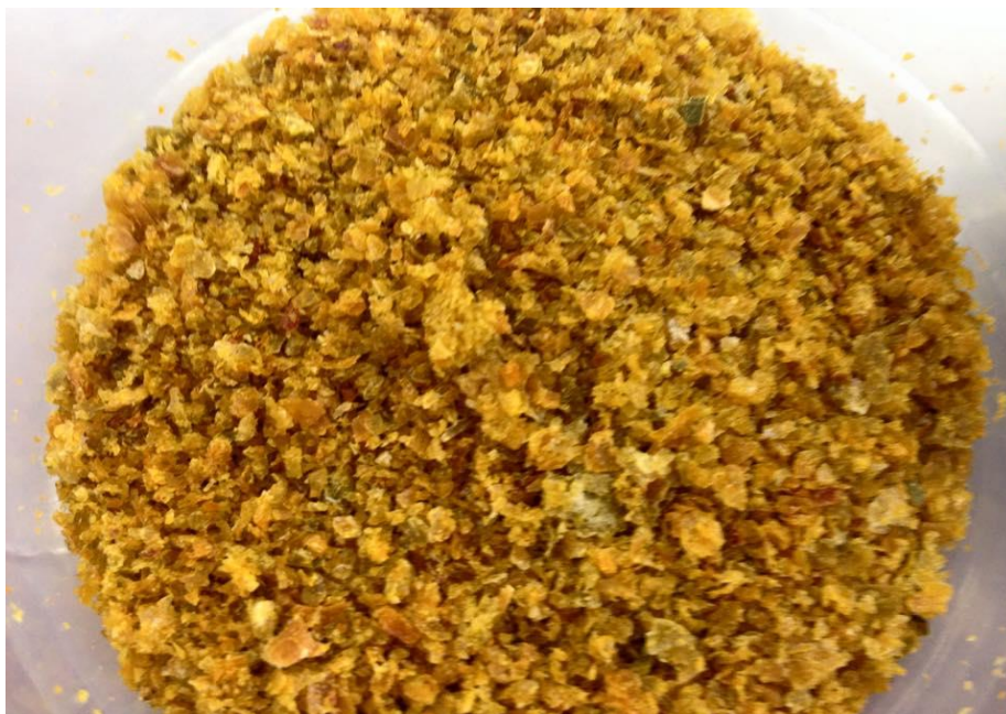
Figura 1: Polpa de cagaita desidratada.