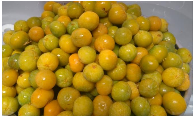
Figura 1. Frutos de Cagaita verdes, maduras.