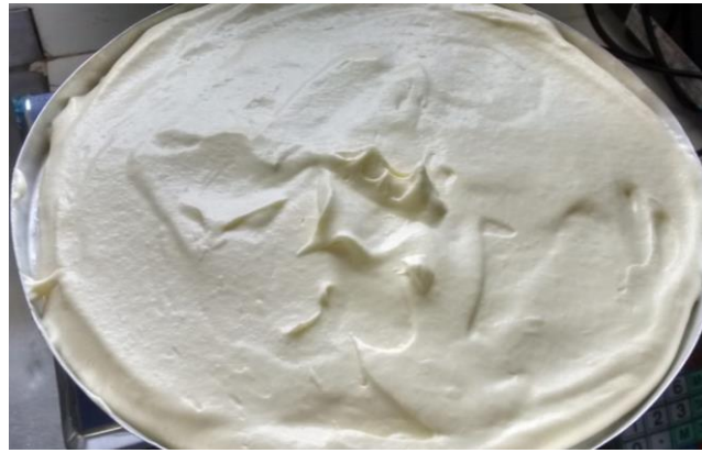
Figura 2. Espuma da cagaita processo um.