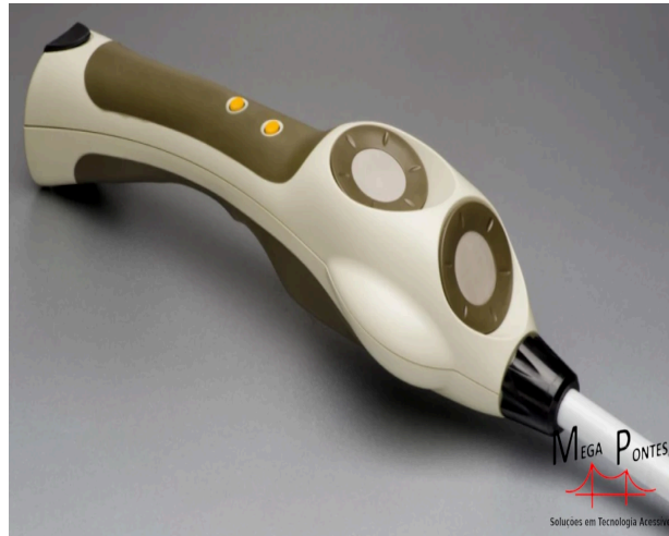
Figura 2 - Bengala eletrônica Ultracane

obstáculo no seu caminho. Elas funcionam emitindo alertas sonoros ou de vibração, ajudando a pessoa com deficiência visual a se locomover de forma mais independente (DE, 2022).