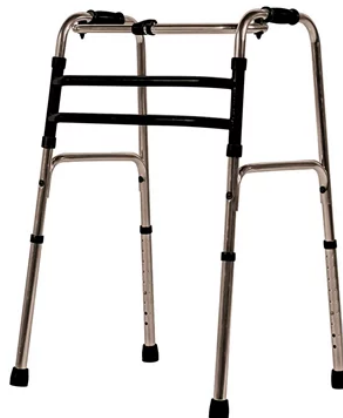
Figura 3 - Andador

Fonte: (“Andador Articulado Mercur Bronze em Alumínio Dobrável”, 2025)