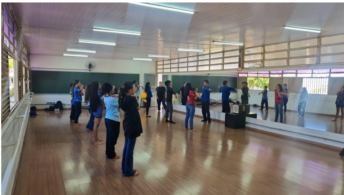
Figura 2: Sala de dança II