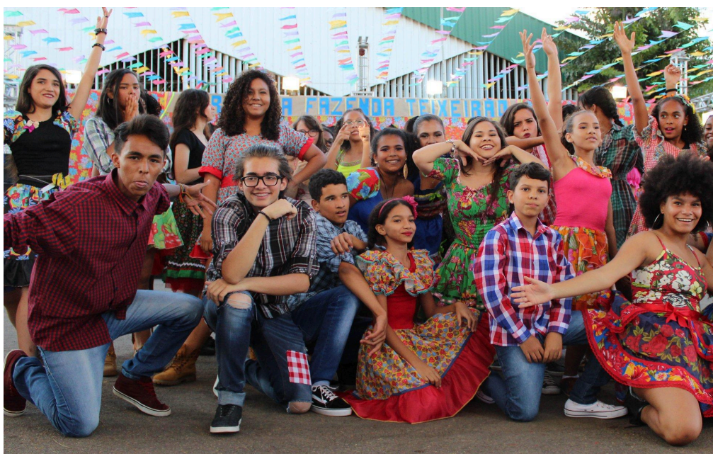
Figura 5: apresentação na festa Junina de 2018

A festa junina é realizada na área externa da escola, com a participação ativa dos estudantes. Durante o evento, apresentam os resultados de diversas oficinas realizadas no primeiro semestre, com as apresentações de dança recebendo um destaque especial na celebração que acontece durante toda a festa.