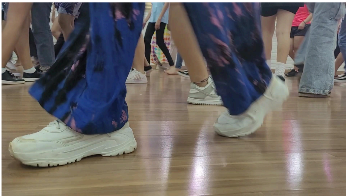
Figura 10: aula observada na pesquisa de campo.