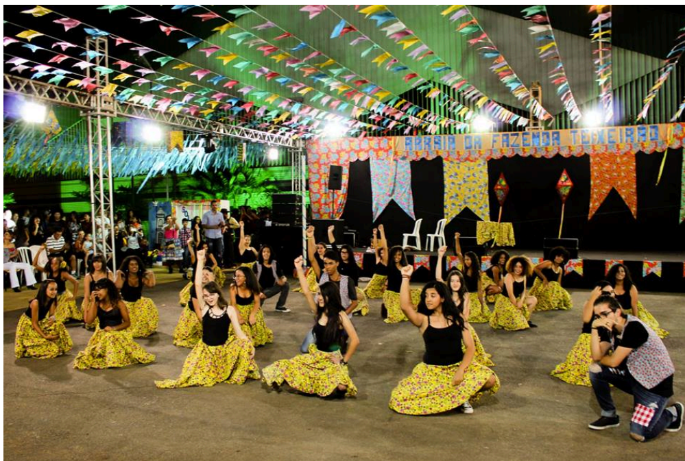
Figura 6: apresentação na festa Junina de 2018