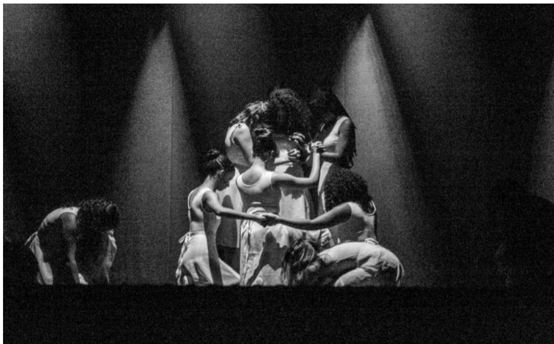
Figura 4: apresentação no DanCei de 2019