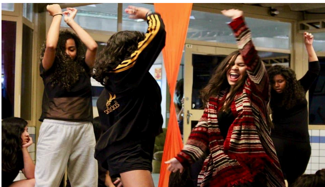
Figura 13: apresentação no intervalo cultural da escola em 2018

Estudar na EPAT, especialmente nas aulas de dança, foi de suma importância para minha experiência como artista. O contato com licenciadas em dança contribuiu para que eu entendesse a dança como forma de conhecimento, além de passar a considerar a dança como uma possível profissão. A partir dessas aulas, hoje sou artista, professora e tenho orgulho de dizer que trabalho com dança. Estudar nesta escola foi uma experiência significativa, especialmente por não poder arcar com os custos de aulas de artes. Essa vivência foi crucial para que me identificasse como uma multiartista e compreendesse o valor e o privilégio que essa instituição representa. Tenho grande respeito pela EPAT, pois sem ela, eu não seria a pessoa que sou hoje!