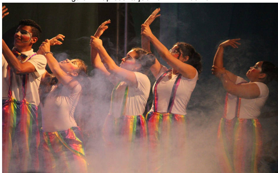
Figura 11: apresentação no FEPAT de 2017

Estudar dança na Escola Parque foi de suma importância para o meu autoconhecimento, para a compreensão do meu papel na sociedade e para o entendimento do que significa viver na periferia. A experiência proporcionada pela dança foi essencial para que eu pudesse me conhecer melhor e me posicionar dentro do meu contexto social. Ao longo dos quatro anos em que estive na escola, tive as mais enriquecedoras experiências, que contribuíram de forma significativa para o meu desenvolvimento.