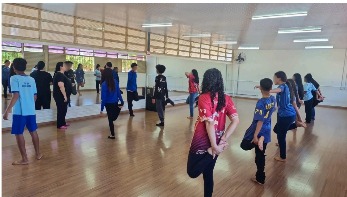
Figura 1: Sala de dança I

A Escola Parque dispõe de duas amplas salas de dança, equipadas com piso de madeira, espelhos, barras de apoio e sistema de som, disponíveis para as aulas ministradas pelos professores de dança.