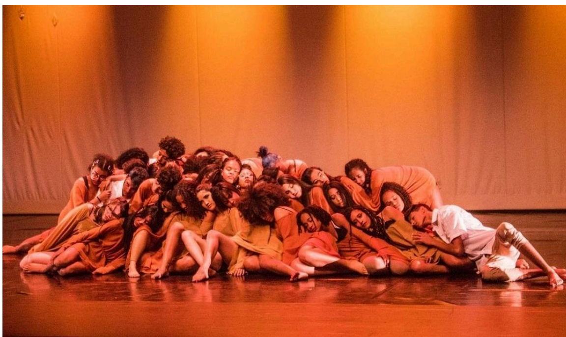
Figura 3: apresentação no DanCei de 2019

Em comemoração ao Dia Internacional da Dança, celebrado em 29 de abril, acontece na EPAT o evento "DanCei" durante a Semana da Dança na escola. Ao longo da semana, são realizados diversos workshops e rodas de conversa, geralmente com a participação de egressos da instituição. O "DanCei" é realizado no auditório da escola, mas sua primeira edição também ocorreu no Sesc da Ceilândia.