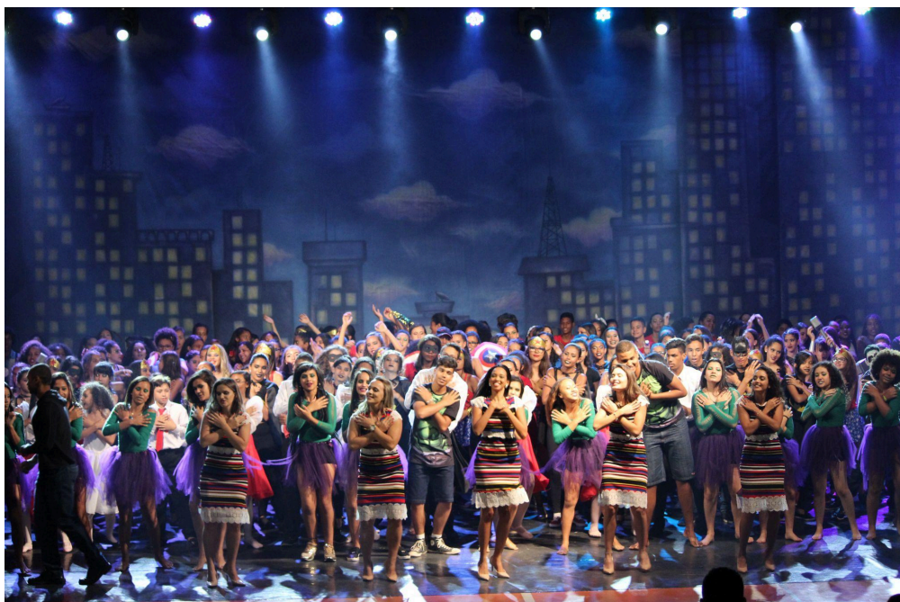
Figura 8: apresentação no FEPAT de 2016