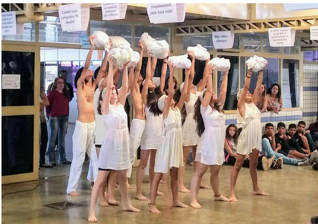
Figura 9: apresentação no intervalo cultural da escola em 2018

As apresentações de dança também ocorrem em outros espaços da escola, como nos intervalos culturais, que frequentemente são realizados no pátio.