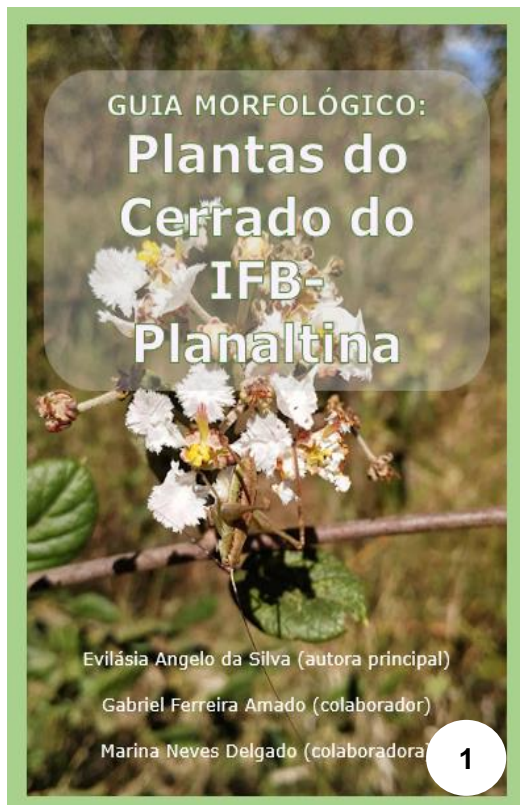
Figuras 1 - 4. Capa e Introdução do GUIA.