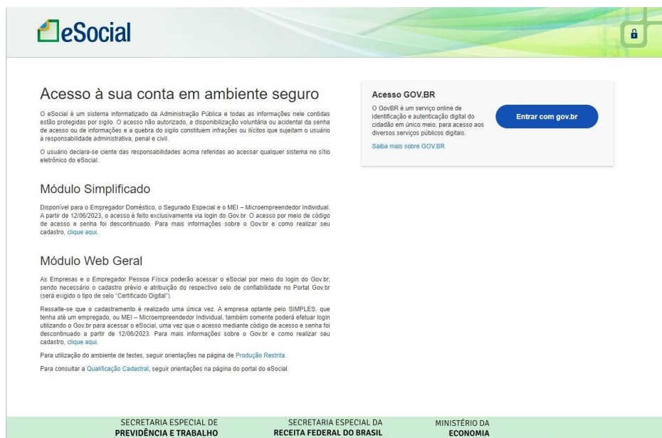
Figura 2 - Acesso ao portal do e-social