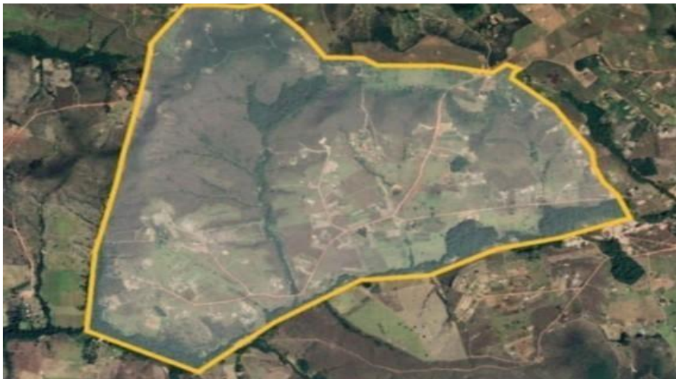
Figura 01- Área do território localizado em São Sebastião, na DF 251 KM.

Em 2015, o Governo do Distrito Federal aprovou o então Projeto de Assentamento 1º de Julho, cuja área já havia sido reconhecida pelo Instituto de Colonização e Reforma Agrária (INCRA) por meio da Portaria SR 28 nº 07 em 27 de fevereiro de 2014. No dia 24 de março de 2015, às famílias selecionadas receberam a última notificação com aprovação de cadastro e garantia do direito à permanência na área de 476 hectares (Figuras 01 e 02).