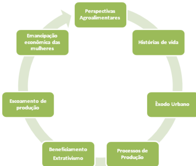
Gráfico 01-Esquema da dinâmica vivenciada por mulheres do 1º de julho.

Podemos representar o movimento vivenciado pelas mulheres do assentamento 1º de julho por meio de aspectos que se relacionam de modo circular, desde as perspectivas agroalimentares, passando pelo êxodo urbano até as mudanças na perspectiva da emancipação econômica (Gráfico 01).