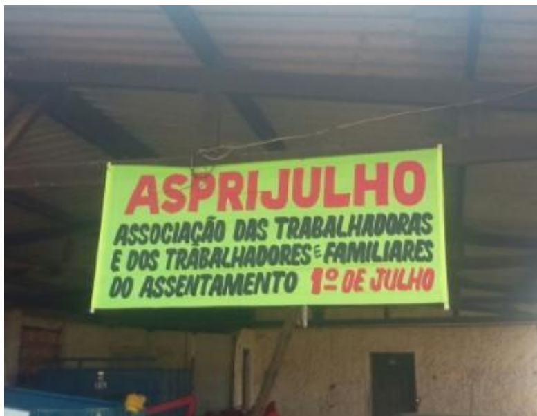
Figura 04 – sede da Associação das Trabalhadoras e dos Trabalhadores e familiares do Assentamento 1º de Julho

As atitudes machistas chegaram ao extremo do desrespeito ao voto da maioria dos assentados na escolha da presidência da Associação. Às escuras, um grupo de homens articulou o movimento de implantar uma segunda Associação gerida por uma figura masculina. A segunda associação, denominada Associação dos Produtores e Agricultura Familiar (SEPAF), foi criada em 2018 por lideranças masculinas em contraposição ao protagonismo feminino na comunidade, no segundo mandato da então presidente e líder do assentamento.