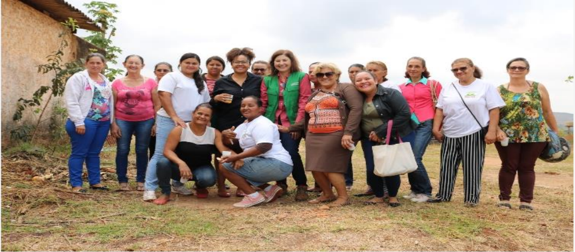
Figura 07-Parte das mulheres assentadas junto a presidente da Emater- DF, Denise Fonseca.

necessários trabalhos externos para complementar a renda e cobrir os gastos da família e a aquisição de insumos para manter a propriedade. A renda extra é obtida através de trabalhos como manicure, diarista, cozinheira, costureira e outros.