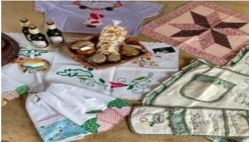
Figura 05 – produtos agroindustriais e artesanais das mulheres do Assentamento 1º de Julho

processamento de alimentos e artesanato.