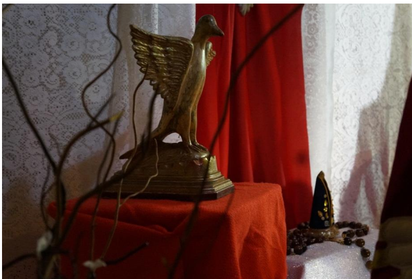
Figura 10: Imagem da Pombinha.