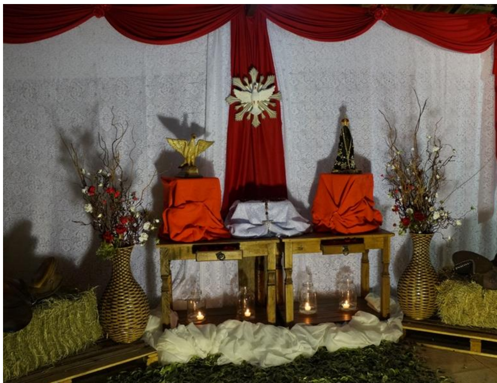
Figura 16: O altar.

No cantório de saudação do altar benze o corpo traçando sobre si o sinal da cruz, na sequência canta a criação do mundo, saúdam as imagens presente no altar e aos donos da casa.