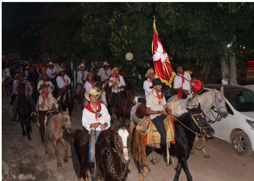
Figura 14: Chegada dos foliões ao pouso.