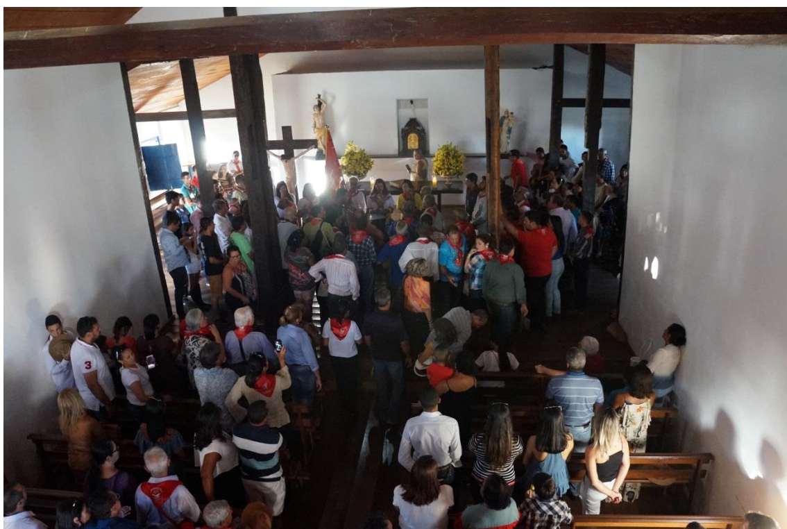
Figura 24: Desalvorada da folia na Igreja de São Sebastião

(Música de Marino Cafundó de Moraes adaptação: Erasmo de Castro)