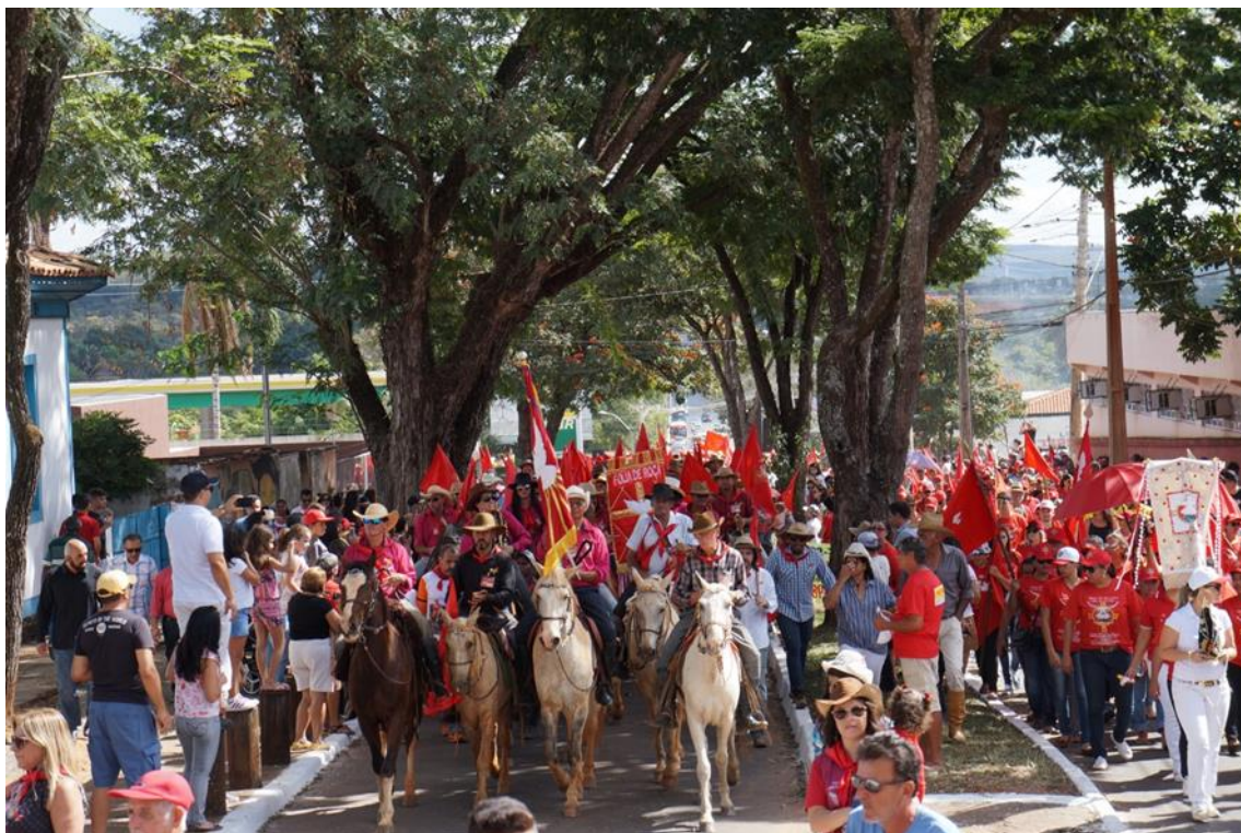
Figura 21: Chegada da folia de roça na cidade de Planaltina