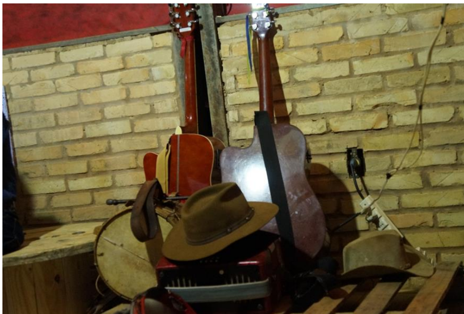
Figura 6: Instrumentos musicais utilizados pelos foliões.