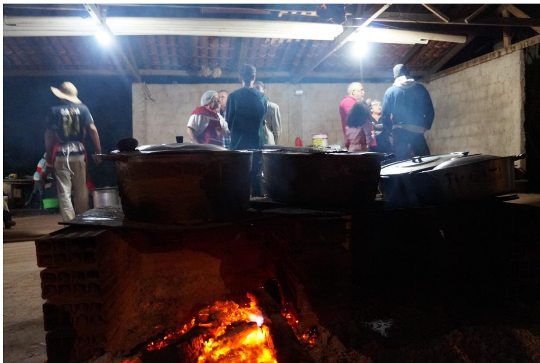
Figura 19: Cozinha da folia de roça