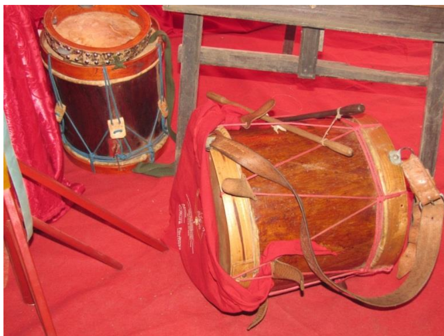
Figura 7: Caixa, primeiro instrumento da folia.