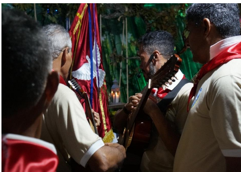
Figura 13: Cantorio diante do altar.

Para Tremura, ( 2005, p.4), “Os cantorios são marcantes nas folias,os versos das toadas articulam as aspirações pessoais e interpretam a visão do mundo aos olhos de seus participantes”. De acordo com Viana, (2013) as narrativas presentes em alguns cantorio têm sua fundamentação em passagens bíblicas, podemos citar como exemplo o cantorio do cruzeiro, onde se canta a vida e a paixão de Cristo. Além disso, seguem uma tradição sequencial no rito como cantorio da chegada e pedida do agasalho saudação do cruzeiro, saudação do altar, cantorios de promessas, Bendito da mesa. Dessa forma podemos entender que “O intuito central do giro da folia é propagar e celebrar estes acontecimentos e, nestes termos, é percebido por muitos foliões como uma evangelização”( VIANA; RIOS, 2013,p. 1)