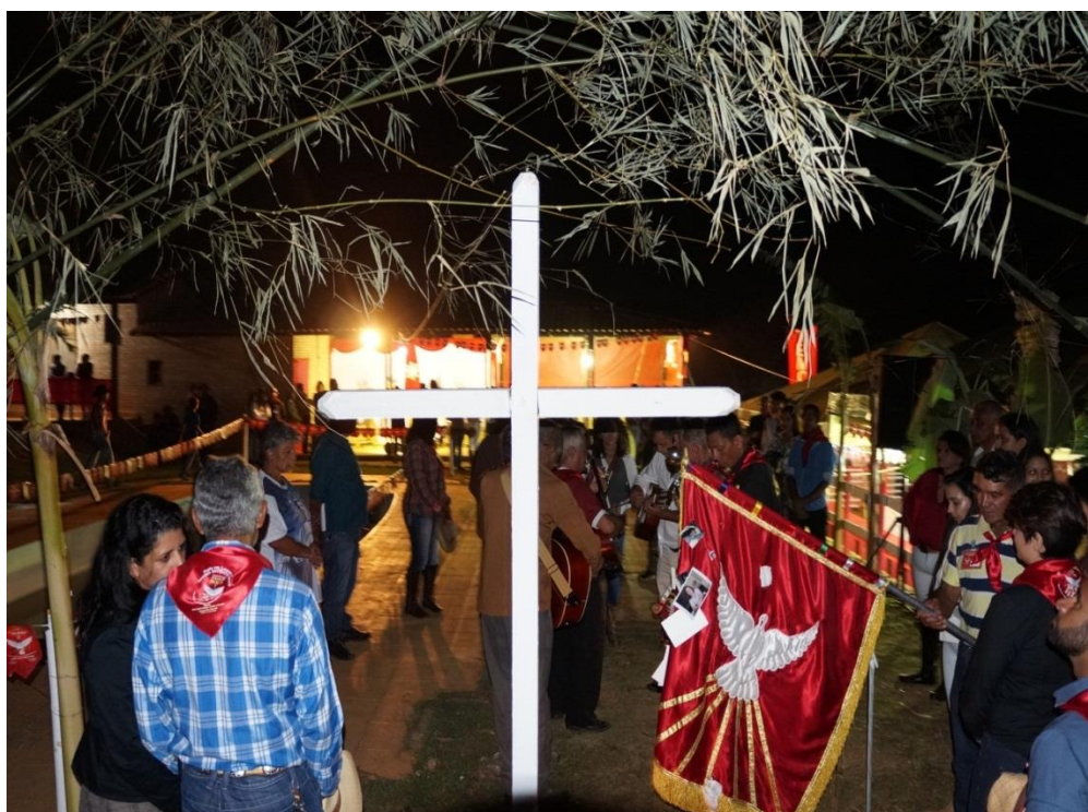
Figura 12: Cruzeiro, com o telegrama.

É posto uma cruz, que é um dos símbolos do cristianismo de frente para a casa e apontado para o altar que normalmente se localiza no interior das residências. De acordo com os entrevistados representa o martírio de Jesus, seu nascimento vida e morte. Fato interessante é a existência de uma linha conhecida como telegrama, que liga o cruzeiro ao altar. Seguindo, o cruzeiro é acompanhado do ruamento, uma espécie de corredor feito com algum tipo de estaca de planta como o bambu.