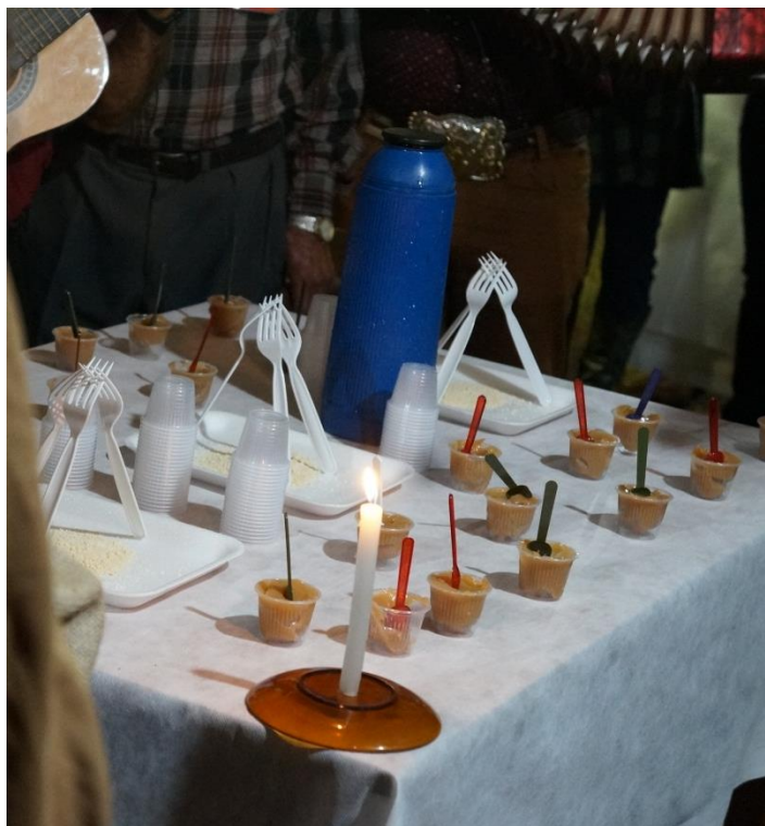
Figura 17: A mesa na hora do Bendito