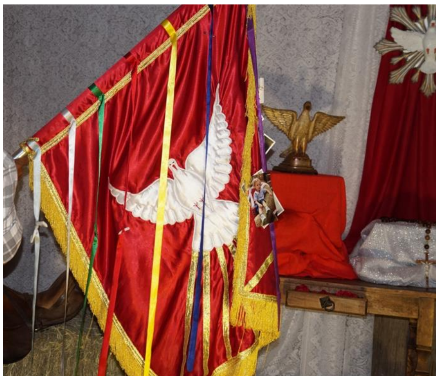
Figura 8: A bandeira

A bandeira segue a frente dos foliões carregada pelo Alferes. Os devotos se inclinam para saudar a bandeira, assim como os foliões ocorrendo grande demonstração de fé e respeito. A bandeira é devoção ao Divino Espírito Santo e se constitui num dos símbolos mais significativos da festa do Divino. De cor vermelha, centralizada na bandeira é estampada a figura da pomba. São coladas tirinhas de fitas coloridas simbolizando os 7 dons do Espírito Santo, além disso, as fotos que os devotos pregam na bandeira em agradecimento ou pedido por alguma graça (TEIXEIRA, 2013).