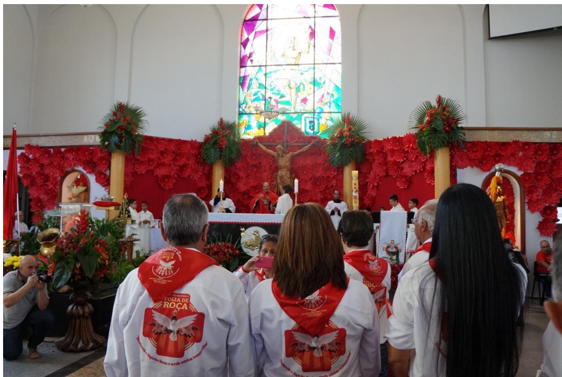
Figura 23: Missa do folião de roça, Igreja Matriz de São Sebastião

novo, pois agora os novos Alferes começam a se prepararem para a festa do próximo ano.