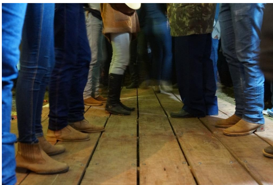
Figura 20: A Catira

sanfona e o pandeiro, tocam com ritmo caracterizado pelo rasqueado e os ponteios, associando a batida de pés e vozes. A dança da curraleira inicia-se com duas fileiras: na sequencia formam um circulo. Existe uma serie de formação, muito semelhante aos passos da Catira, sendo que os movimentos são mais rápidos e as modas de violas que acompanham mais animadas. A cada final de versos eles trocam de lugar uns com os outros, no final todos voltam ao lugar de onde começaram (RODRIGUES, 2011).