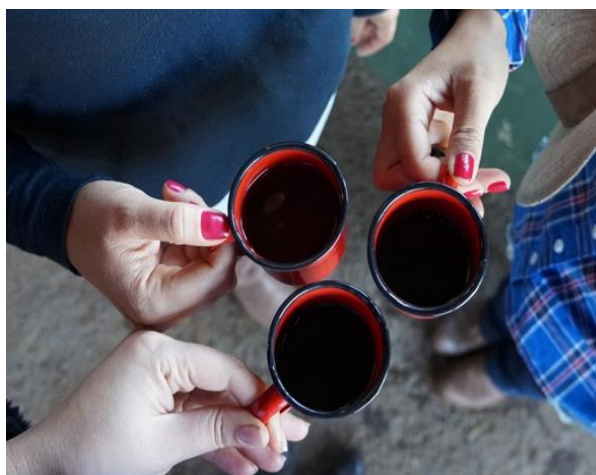
Figura 5: Café oferecido na mussunga.