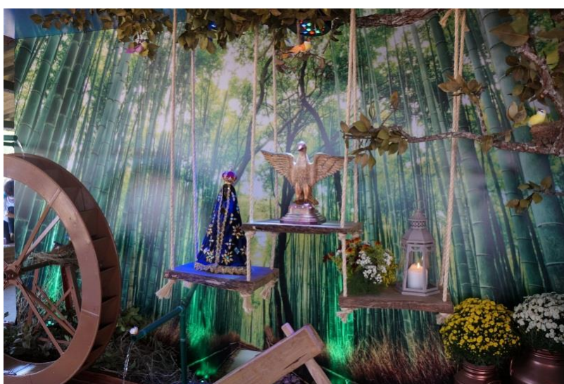
Figura 9: Símbolos da folia