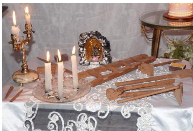
Figura 15: Símbolos do Martírio de Cristo utilizados no cruzeiro.