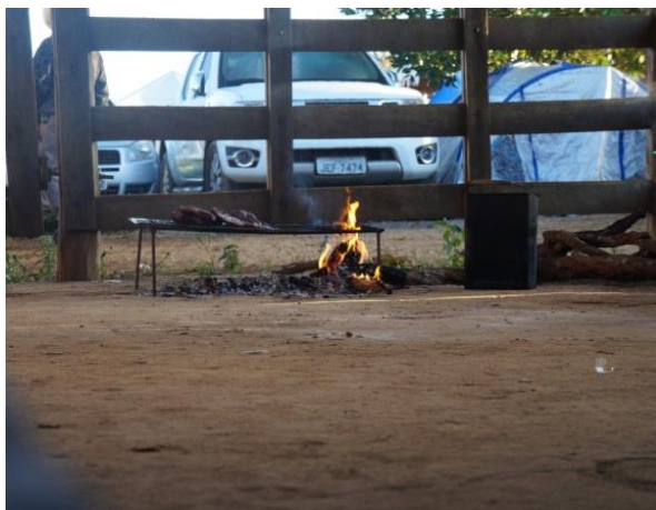
Figura 4: Churrasqueira na mussunga.