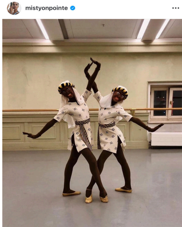
Figura 2 - La Bayadère e bailarinas russas do Ballet Bolshoi

atuar na produção de La Bayadère do Balé Mariinsky. 10 (Copeland, 2019 apud Nichols, 2019. tradução nossa.)