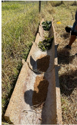
Figura 1: Representação da distribuição dos alimentos no Cocho

O observador colocou os alimentos nos cochos, seguindo uma ordem aleatória e de forma que todos os alimentos ao final do experimento ocupassem todos os locais de cochos (Fig.1), evitando assim a interferência de maior consumo de um alimento, devido a preferência de local de consumo. Essa distribuição era realizada às 9 da manhã e as sobras pesadas às 9 da manhã do dia seguinte. O experimento foi realizado por 5 dias consecutivos, durante 4 semanas.