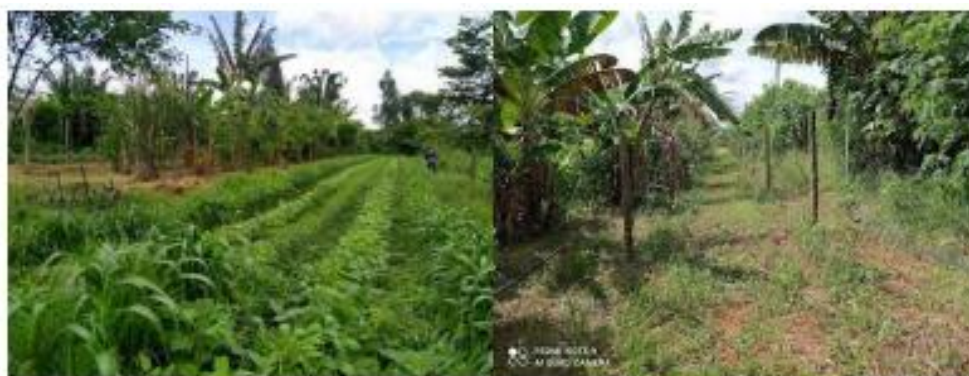
Figura 3 -Visão geral do SAF localizado no IFB Campus Planaltina

A implementação dessas espécies no SAF está relacionada aos seguintes aspectos: à quantidade de material orgânico depositado, facilidade de plantio, adaptação ao solo,