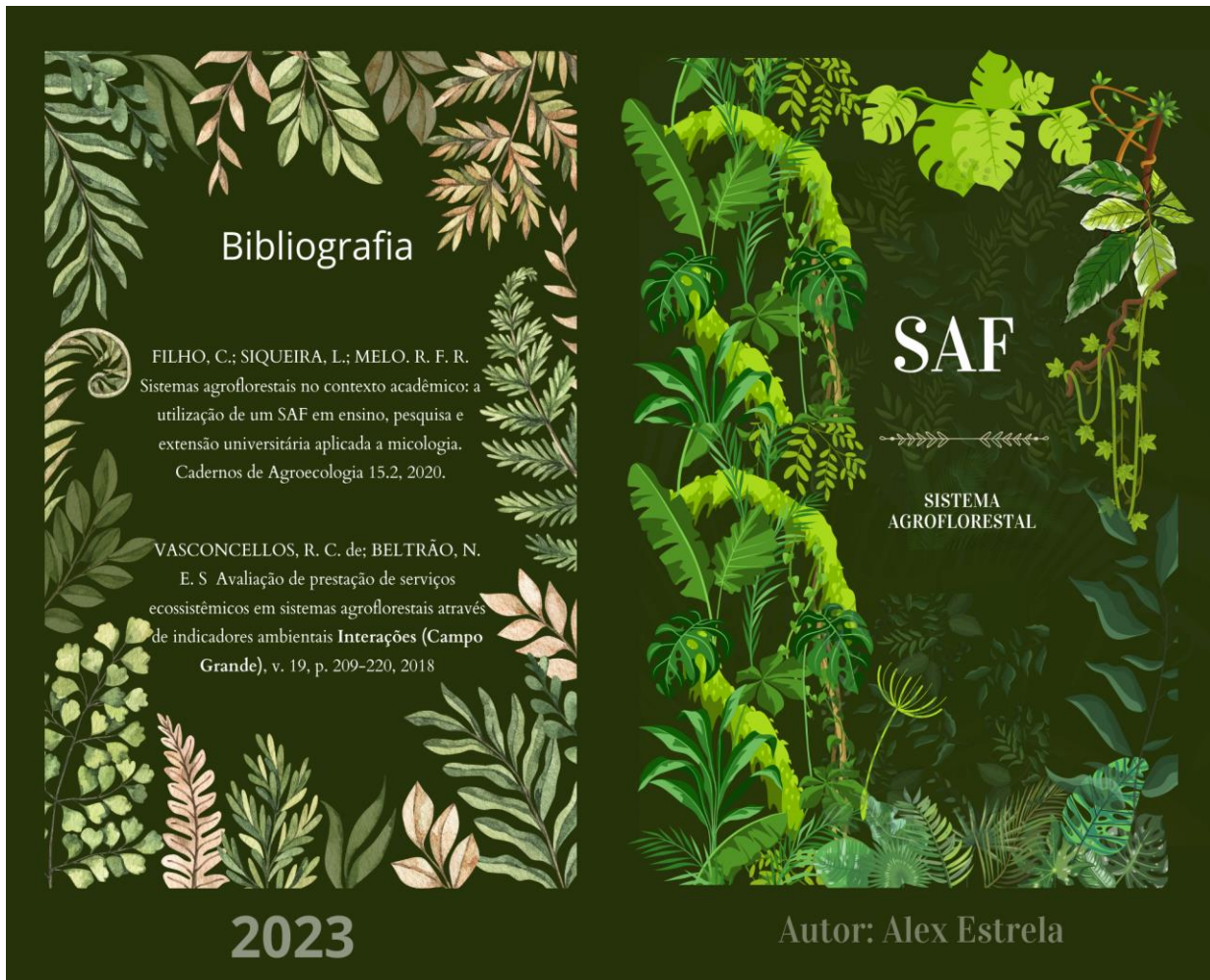
Apêndice 1- Bibliografia e capa do material didático produzido.