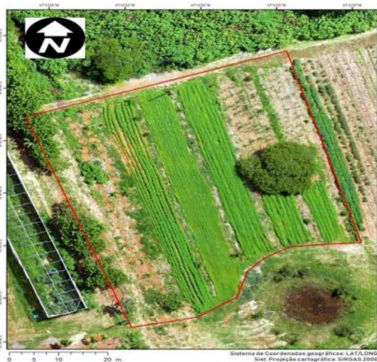
Figura 1. Área total do SAF

A referida área tem 0,84 ha, dos quais inicialmente 0,40 ha foram destinados ao SAF. A declividade e altitude média do terreno são respectivamente de 3,8% e 940 m, com coordenadas geográficas Latitudes Sul 15^{\circ} 39' 38'' e 15^{\circ} 39' 32'' , e Longitudes Oeste 47^{\circ} 41' 22'' e 47^{\circ} 41' 17'' e predominantemente ocupada pela espécie vegetal Brachiaria decumbens havendo partes com solo exposto.