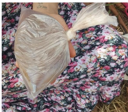
Figura 13 - Amostra de solo.