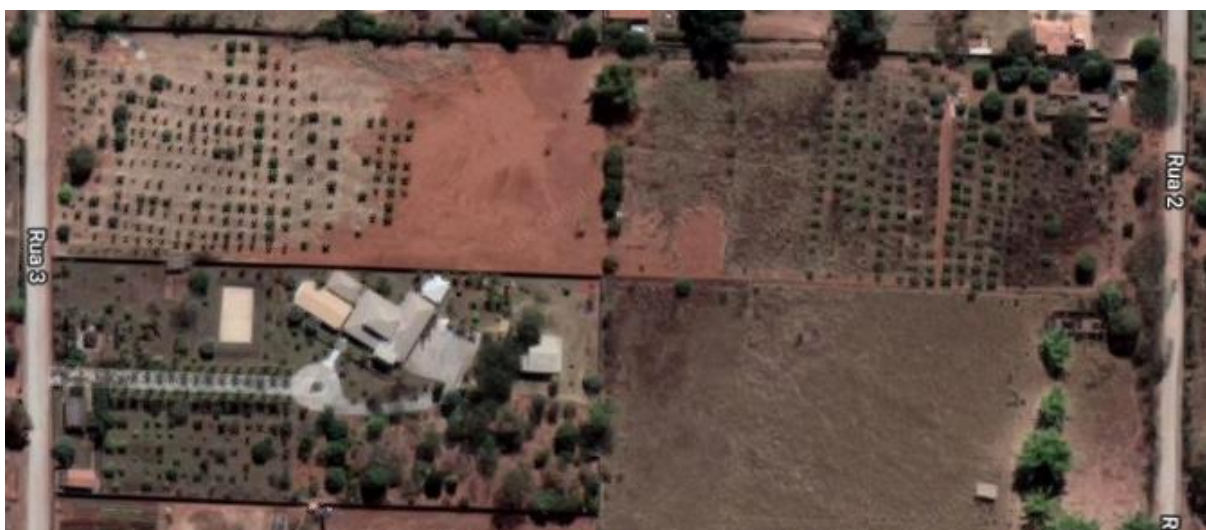
Figura 6 - Propriedade vista de cima.

O diagnóstico e projeto de revitalização foi elaborado em uma propriedade rural localizada na DF-001, Núcleo Rural Lago Oeste, Rua 3, que pode ser visualizada por imagem de satélite na Erro! Fonte de referência não encontrada.