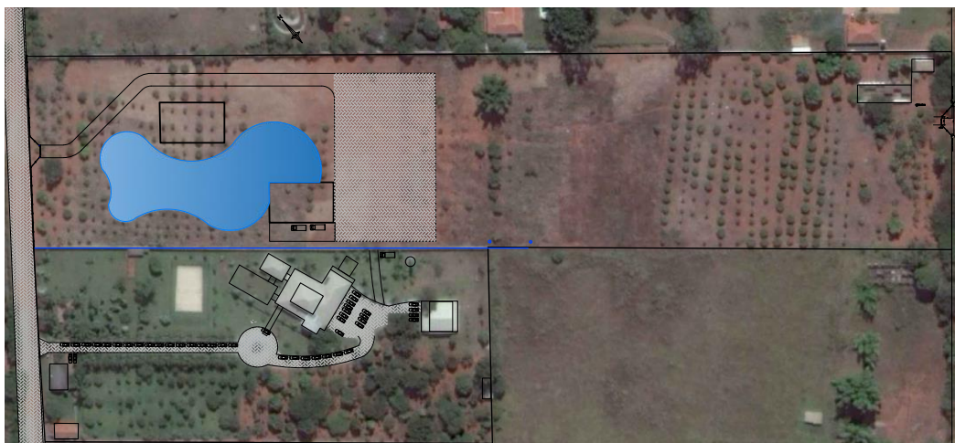
Figura 16 - Projeto do Lago.