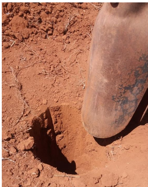
Figura 11 - Retirando a amostra de solo.