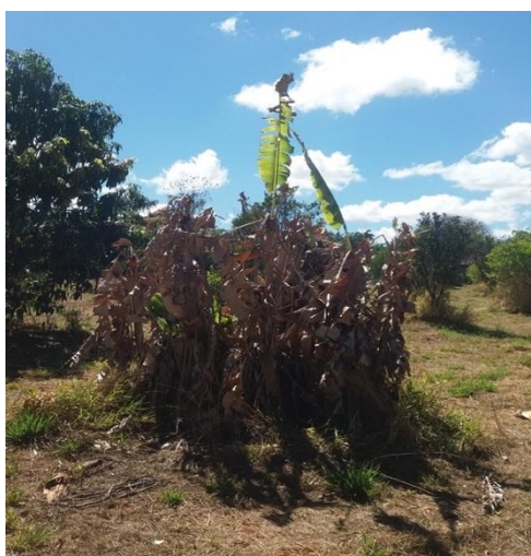
Figura 9 - Bananeira.