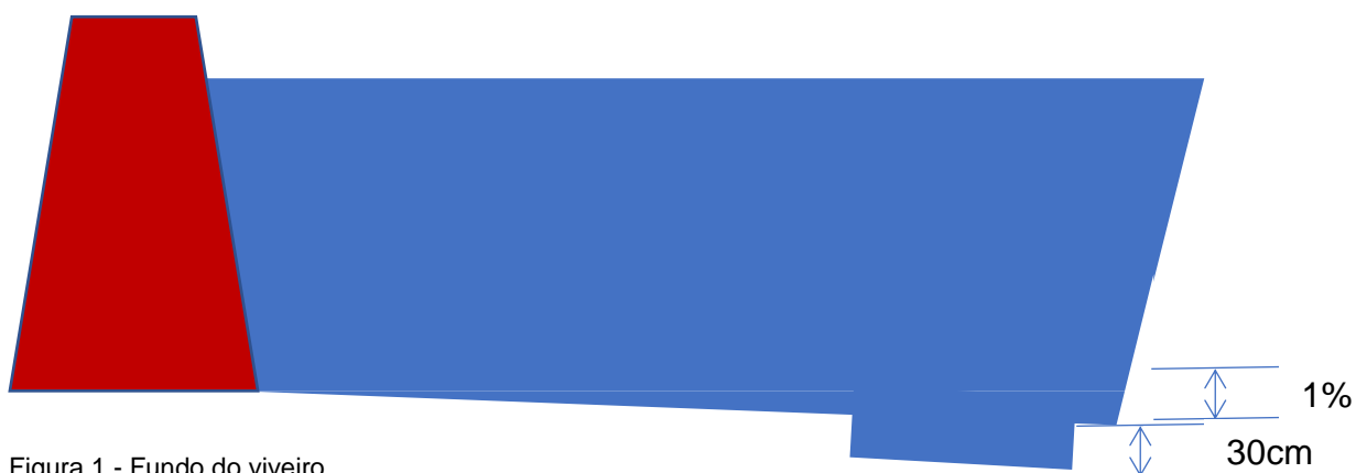
Figura 1 - Fundo do viveiro.