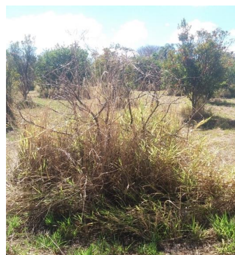
Figura 10 - Árvore morta.