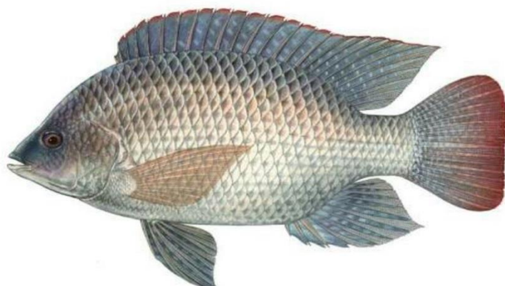
Figura 4 - Tilápia do Nilo ( Oreochromis niloticus ).

Faria et al. (2013) afirma que no Brasil, o mercado aceita tilápias com mais de 600 gramas. São necessários 8 a 12 meses de criação para produzir peixes com 800 gramas a 1 quilo.