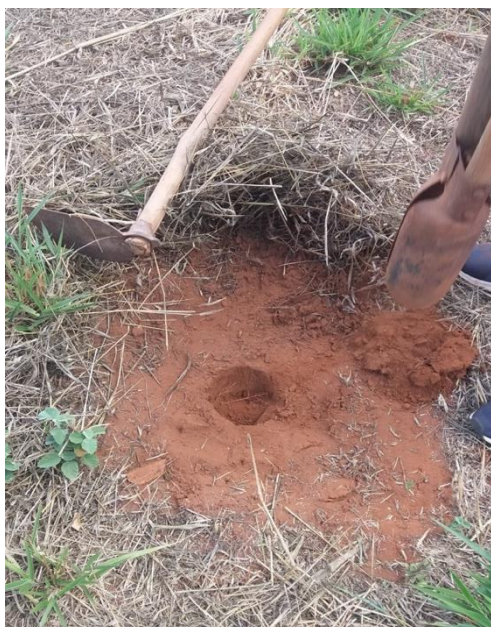
Figura 12 - Limpeza da área.

As amostras foram coletadas aleatoriamente no pomar da propriedade de pontos diferentes, longe de formigueiros, passagens de pedestres e animais, a uma profundidade de 0-20 cm. Depois foram misturadas em um balde, pedras, capim e torrões maiores foram retirados. Uma quantidade de mais ou menos 300 gramas foi colocada em um saco plástico e etiquetada com a data de coleta, nome do proprietário, profundidade e instituição.