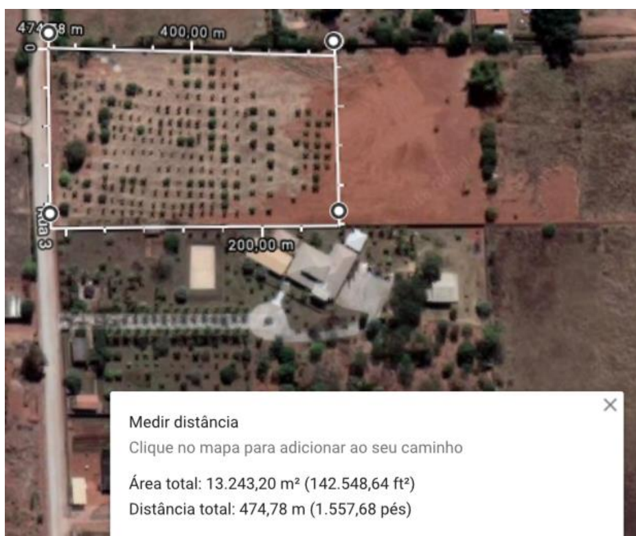
Figura 7 - Pomar visto de cima.

O inventário florístico foi realizado no pomar da propriedade rural no Núcleo Rural Lago Oeste em uma área retangular de 13.243,20m 2 com a finalidade de conhecer as espécies existentes, o estado em que elas se encontravam para serem transplantadas e fazer um reconhecimento da propriedade.