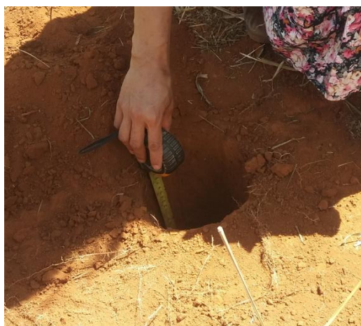
Figura 14 - Verificando a profundidade.