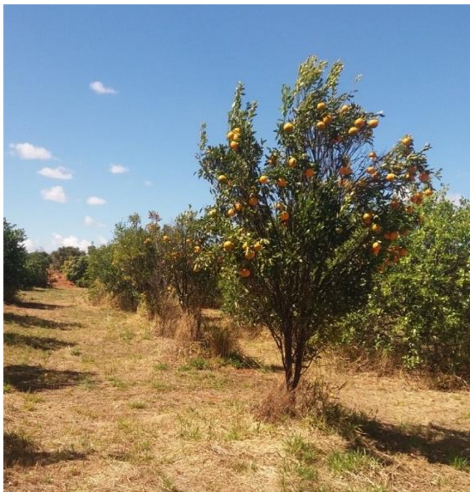
Figura 8 - Pomar da propriedade.

A contagem dos berços foi estratificada em três categorias: árvores produtivas, não produtivas e mortas. As árvores consideradas não produtivas foram aquelas que apresentaram algum problema seja na estrutura, manejo, irrigação, poda ou falta de desbrota do porta-enxerto.