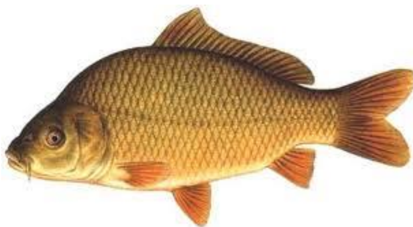
Figura 3 - Carpa Comum ( Cyprinus carpio ).

Faria et al. (2013) afirma que no Brasil as espécies mais utilizadas são a carpa comum, carpa capim e carpa cabeça grande. A temperatura ideal para o crescimento é de aproximadamente 28°C, abaixo de 15°C as carpas diminuem a ingestão de alimento e o crescimento. As carpas resistem a baixas concentrações de oxigênio dissolvido na água.