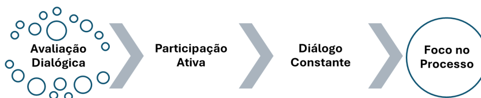
Figura 01 - Princípios que norteiam a avaliação dialógica