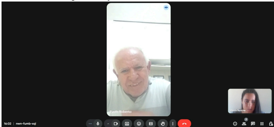
Figura 1 - Captura de tela do momento da entrevista.